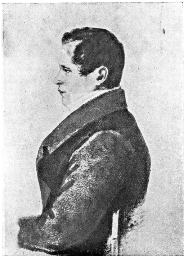
И. И ПУШКИН. 1798—1859.

Акварель художника Д. Соболевского. 1825 г.