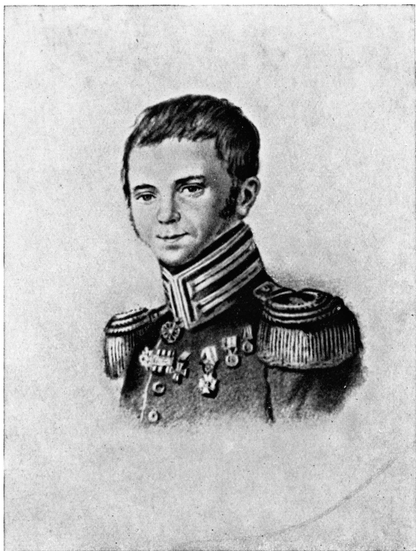
Ф. Н. ГЛИНКА.