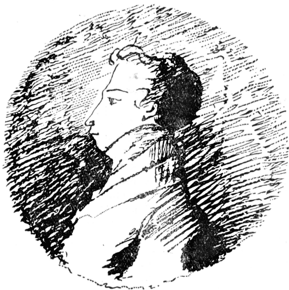
АВТОПОРТРЕТ А. С. ПУШКИНА 1820—1821 гг.